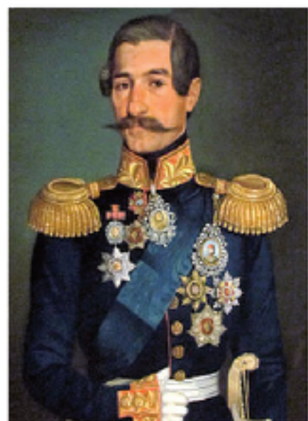
Александър Караджорджевич (1806-1885) - Княз на Княжество Сърбия (1842-1858)