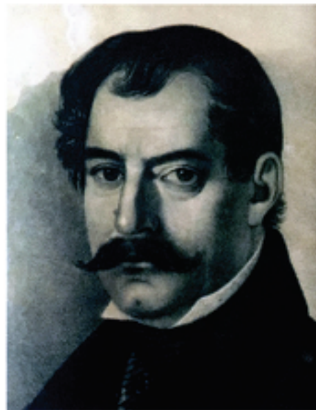
Аврам Петрониевич Стекич (1791-1852) - личен пълномощник на Княза (министър-председател на Княжество Сърбия) и министър на външните работи, кавалер (1844-1852)