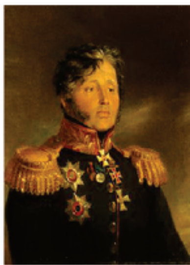
Генерал-майор Иван Василиевич Сабанеев (1770-1829) - първият освободител на Поликрайще